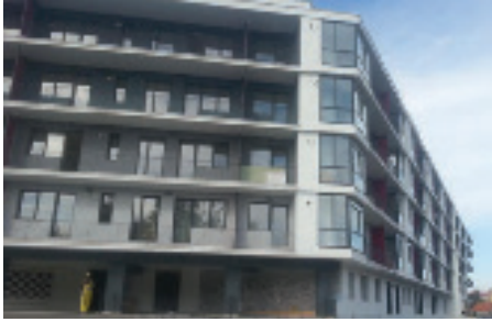
ვიჟიონ- სტუდია Green Cluj-Napoca რუმინეთი

“მწვანე სახლების” და “მწვანე დაკრედიტების” პროგრამის შერჩეული პროექტები