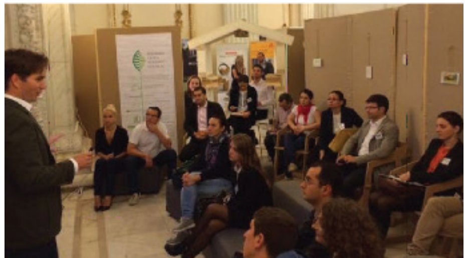
Green Home Pavilion@TNI