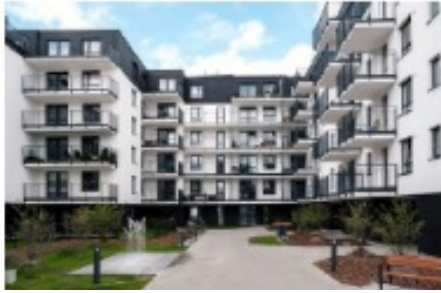
კამელია ვარშავა - Bouygues Immobilier Polska ვარშავა, პოლონეთი

პროექტი შედგება დასრულებული 177 ბინისგან. შენობაში მიღწეულია ენერჯის თითქმის 40%-იანი დაზოგვა სტანდარტულთან შედარებით, შენობის არსებული კონსტრუქციების გამოყენებით მიღწეულ იქნა რესურსების გამოყენებისა და სამშენებლო ნარჩენების შემცირება. შენობა დაკავშირებულია ქალაქის ცენტრთან საზოგადოებრივი ტრანსპორტით და მისგან ფეხით სავალი მანძილზე მდებარეობს უამრავი ობიექტი, სავაჭრო ცენტრებისა და სკოლების ჩათვლით. ეს იყო პირველი მწვანე სახლი, რომლის სერტიფიცირება განახორციელა რუმინეთის მწვანე შენობების საბჭომ.