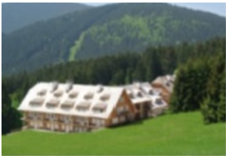
Šumavský Dvůr Železná Ruda ჩეხეთის რესპუბლიკა

ეს საცხოვრებელი კომპლექსი ექსპლუატაციაში შევიდა 2014 წელს და მას პირველს მიენიჭა მწვანე შენობების საბჭოს ოქროს სერტიფიკატი. კომპლექსის საერთო ფართობი 1,067 კვ. მ შეადგენს და ენერჯომომხარების მიხედვით ის მოიცავს A კლასის 8 საცხოვრებელ ბინას. ამ კომპლექსის მშენებლობისას გამოყენებული ტექნოლოგიები მოიცავს: თბურ ტუმბოს გათბობა-გაგრილების სისტემებისთვის, მექანიკური ვენტილაციის სისტემას სითბოს აღდგენით (რეკუპერაციით) სანიტარული მიზნებისთვის, შხის წყალგამაცხელებელ და ფოტოელექტრულ სისტემებს ელექტროენერჯის მისაღებად, სამმაგი შეშინვის ფანჯრებს და წვიმის წყლის უტილიზაციის ავზს.