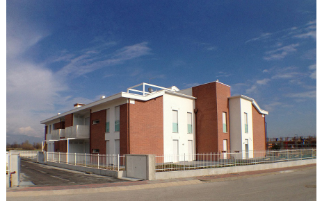
რეზიდენცია გალილეო კოსტაბისარა, იტალია

პოლონეთის დედაქალაქში მდებარე ამ საცხოვრებელი სახლის მშენებლობა დასრულდა 2018 წელს და იგი სერთიფიცირებულია გარემოსდაცვითი მაღალი სტანდარტის შესაბამისად. შუაგულ ვარშავაში მდებარე ამ საცხოვრებელი სახლის საერთო სასარგებლო ფართი შეადგენს 7,900 კვ.მ. და მასში განთავსებულია 161 მაღალი ხარისხის, დაბალი ენერჯომომხარების ბინა.