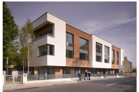
Rathmines Crescent - დუბლინის საქალაქო საბჭოს პროექტი ირლანდია

პროექტის დეველოპერი, რომელიც აქტიური მოთამაშეა რუმინეთის ზაზარზე, შეთანხმდა იმაზე, რომ დააკმაყოფილებდა ყველა იმ აუცილებელ სასერტიფიკატო კრიტერიუმს, ბუქარესტის ჩრდილო-აღმოსავლეთში მდებარე 1,688 ბინიანი მრავალსართულიანი საცხოვრებელი კომპლექსისთვის. მწვანე ენერჯეტისა და ენერჯოეფექტურობის ყველა სტრატეგია გათვალისწინებულ იქნა პროექტირების საწყის ეტაპზე, ისევე როგორც სამშენებლო მოედნის მენეჯმენტისა და ნარჩენების თავიდან აცილების გეგმის შემუშავება და მოზინადრეთა შესახლების შემდგომ შენობის მართვა.