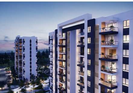
AFI City Bucurestii Noi - ავტორი AFI Europe ბუქარესტი, რუმინეთი

Šumavský Dvůr არის უნიკალური სახლი მთაში ბოჰემიის ტყის შუაგულში, ჰარმონიულ ბუნებაში, უნიკალური ხედიით და მთელი წლის განმავლობაში სხვადასხვა სპორტული ღონისძიებებით. იგი გათავაზობთ უმაღლესი სტანდარტების არქიტექტურასა და კომფორტულ მომსახურებას. სახლის ადგილმდებარეობა შეირჩა შესანიშნავ კლიმატურ და მყუდრო ზონაში ისე, რომ არ დაზღვეულიყო ადგილობრივი ლანდშაფტის ხასიათი. სახლი დაპროექტდა როგორც კომფორტული და ასევე მდგრადი, რადგან ის აშენდა ბუნებრივი განახლებადი სამშენებლო მასალებით და მას მიენიჭა SBTtoolCZ (შენობებისა და პროექტების მდგრადი მახასიათებლების შეფასების სისტემა) ვერცხლის სერტიფიკატი.