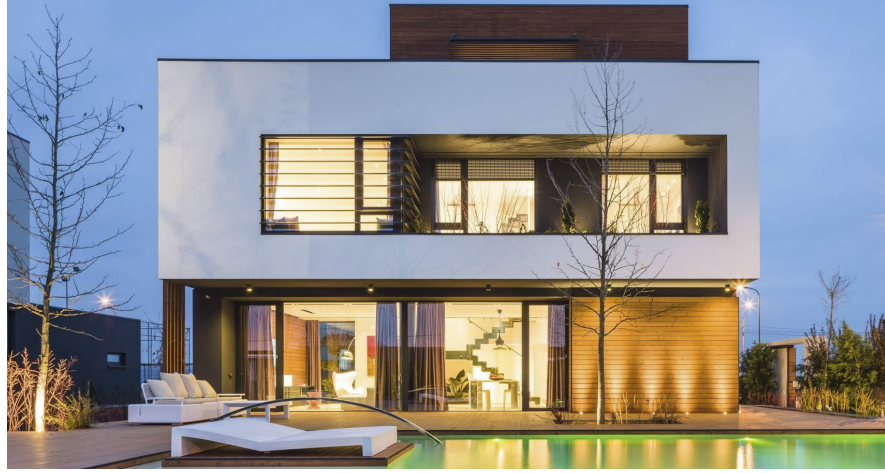
ROGBC-ს მიერ სერტიფიცირებული პირველი მწვანე სახლი ბუქარესტში: ალესიონორის "AMBER GARDENS"

„მწვანე“ სახლების შექმნის მხარდაჭერა სერტიფიცირების სახელი და ხარჯეფექტური პროგრამის დანერგვით საშუალებას აძლევს ინვესტორებს და დეველოპერებს მოახდინონ თავიანთი სამშენებლო პროექტების ხარისხის და ეკოლოგიური მაჩვენებლების დიფერენცირება, მომხმარებლების ინფორმირებასთან ერთად ფინანსური და სხვა სარგებლების შესახებ. ფინანსურ ინსტიტუტებს – სერტიფიცირებულ მწვანე სახლებთან დაკავშირებული მწვანე იპოთეკური კრედიტების გაცემით – შეუძლიათ მნიშვნელოვნად შეამცირონ იპოთეკური კრედიტების დეფოლტის რისკი და აამაღლონ იმ სახლების აქტივების შეფასება, რომლებსაც ისინი აფინანსებენ, და შესაბამისად, შეუძლიათ შესთავაზონ უფრო იაფი დაფინანსება. დაფინანსების ხარჯების შემცირება მყიდველს ანიჭებს მეტ მსყიდველობით უნარიანობას მშენებლობის ხარისხის გაუმჯობესებაში ინვესტირებისთვის, რადგანაც მწვანე დაკრედიტება ზუსტად აფასებს ენერჯიაზე, რემონტზე და სამედიცინო მომსახურებაზე გაწეული დანახარჯების მნიშვნელოვან შემცირებას მათთვის, ვინც იძენს „მწვანე სახლებს“. „მწვანე დაკრედიტება“ ასევე დაეხმარება საქართველოს ბაზარს უკეთესად შეაფასოს გონივრული სესხის დადებითი ღირებულება მშენებლობის საწყის სტადიაზე სწორი ინვესტირებისათვის.